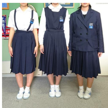
【B タイプ】夏服・合服・冬服 (スカートの場合)