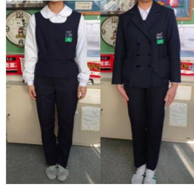
合服・冬服 (スラックスの場合)