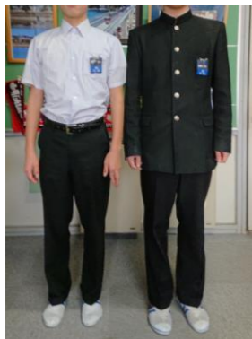
【A タイプ】夏服・冬服