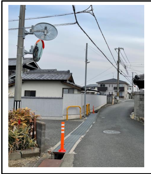
踏切から北へ約30mほどのT字路