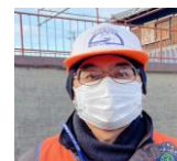
連絡されたスクールガードさん

このT字路にカーブミラーを設置する要望書は福里自治会から提出済みであり、市の設置計画は進行中であったので、現場を見て担当部署である明石市都市局道路安全室道路整備課に早期設置をお願いします。