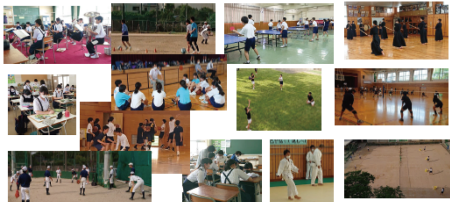
真剣に実力テストに取り組む3年生