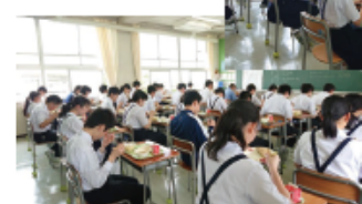
新しい学校生活での給食スタイル