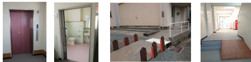
本校用務員が作成（本校舎西側）

学校においては、エレベーターやバリアフリースイレの設置、段差の解消等のハード面の充実だけでなく、小学校では手話体験教室の実施、本校では、総合的な学習の時間を中心に、パラリンピック教育教材「I'm possible」を活用した授業やSDGsについて学ぶ授業等を行い、共生社会を実現するための「心のバリアフリー」を推進しようとしています。