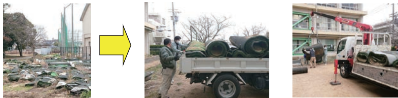
※明石公園テニスコートの張替えで、はがされた人工芝が明石公園に破棄されているので頂きました。